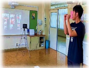
休校中は部活もオンライン!

高1 探究の時間〜ロイロシートでプレゼン! グローバル化の是非が問われる今だからこそ、異文化理解を進めていく必要があります。高校入学直後の休校に不安を募らせていた高1の生徒たちですが、来年度の修学旅行に向けた学習が始まりました。マレーシア・シンガポール、グアム、沖縄の三地域について調べています。先日は、学習アプリ「ロイロノート」を使って、それぞれの地域の魅力度について発表しました。